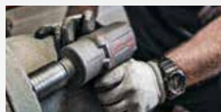
Onderhoud van faciliteiten