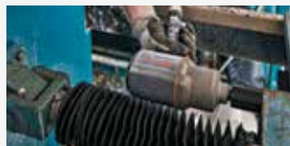
Industria en general