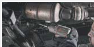
Automoción en general

Una excelente herramienta, potente, duradera y fiable cuya reputación se forja ayudándole a forjar la suya. Ha sido sometida a estrictas pruebas, golpes, caídas y llevada al límite para asegurarnos de que siempre funcionará cuando usted más la necesite. La Serie 2235 es increíblemente potente, duradera y fiable de modo que cumple cada vez que usted necesita que el TRABAJO DE VERDAD esté bien hecho.