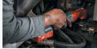
Réparation d'équipements lourds