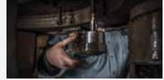
Maintenance de sites