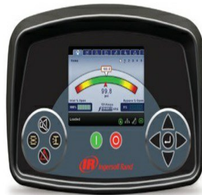
Xe-145F Series Centrifugal Compressor Controller