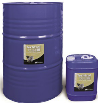
Lubricante Techtrol Gold para compresores