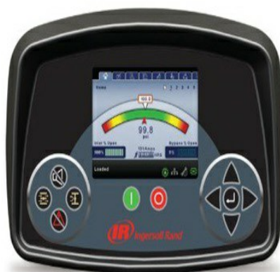
Xe-145F Series Centrifugal Compressor Controller