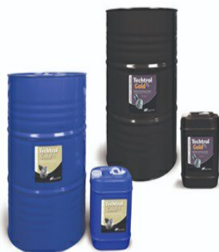
Techrol Gold Centrifugal Compressor Lubricant