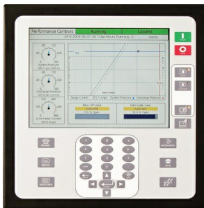
Sistema de control MAESTRO Universal para los