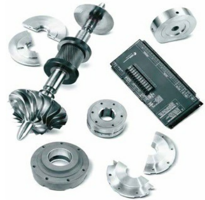
Ersatzteile für TURBO-AIR Turbokompressoren