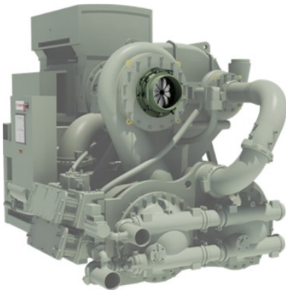
Upgrade – variabler Eintrittsleitapparat für