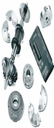
MSG® 離心 式壓縮機替 換零件