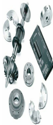
MSG® TURBO- AIR® 離心式 壓縮機替換 零件