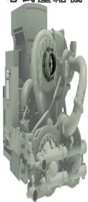
升級 - 離心 式壓縮機的