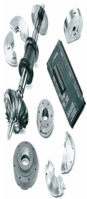
MSG® Centac® 離 心式壓縮機