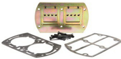
Small Reciprocating Valve Kits