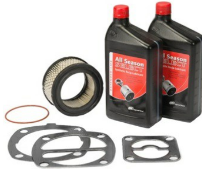
Small Reciprocating Maintenance Kits