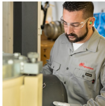
Revisie op locatie