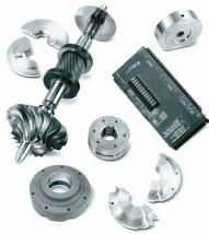
Vervangingsonderdelen voor de MSG ® TURBO-AIR ® -centrifugaalcompressor