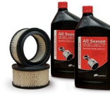
Small Reciprocating Start-Up Kits