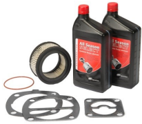
Small Reciprocating Maintenance Kits