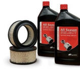
Small Reciprocating Start-Up Kits