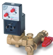
Electronic Drain Valves