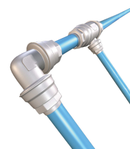
SimplAir Compressed Air Piping