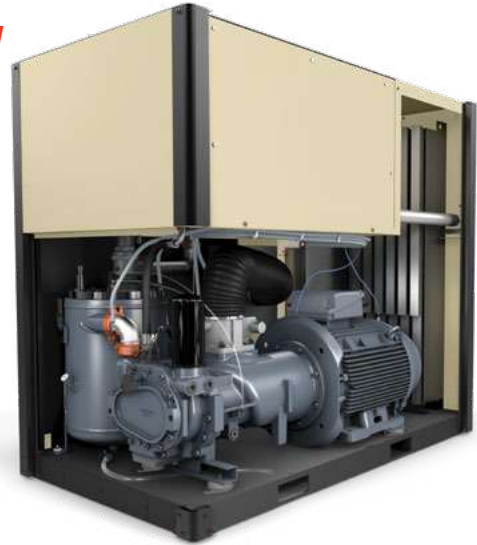
Los compresores Next Generation R-Series proporcionan unas opciones superiores en lo relativo a los componentes, las ventajas y las características de funcionamiento.

Nuestro control de velocidad variable (VSD) opcional puede ayudarle a ahorrar aún más en costes energéticos. Estos compresores proporcionan una alta eficiencia incluso a cargas parciales.